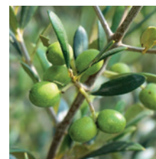
Grossissement des Fruits 2 ème stade