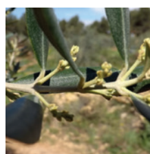
Formation des grappes florales