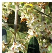
Chute des pétales