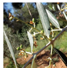
Grossissement des Fruits 1 er stade