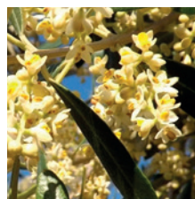
Début de la floraison