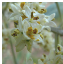
La Pleine floraison