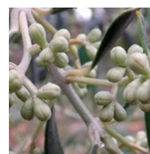
Différenciation des corolles